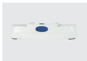
BATERÍA DE 8 CELDAS