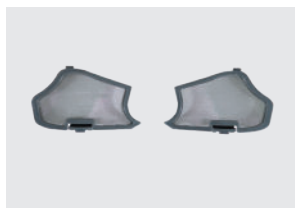
FILTRO EXTERNO PARA PARTÍCULAS GRUESAS