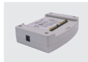
CARGADOR DE BATERÍA DE ESCRITORIO (OPCIONAL)