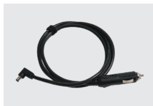
CABLE DE ALIMENTACIÓN DE CC